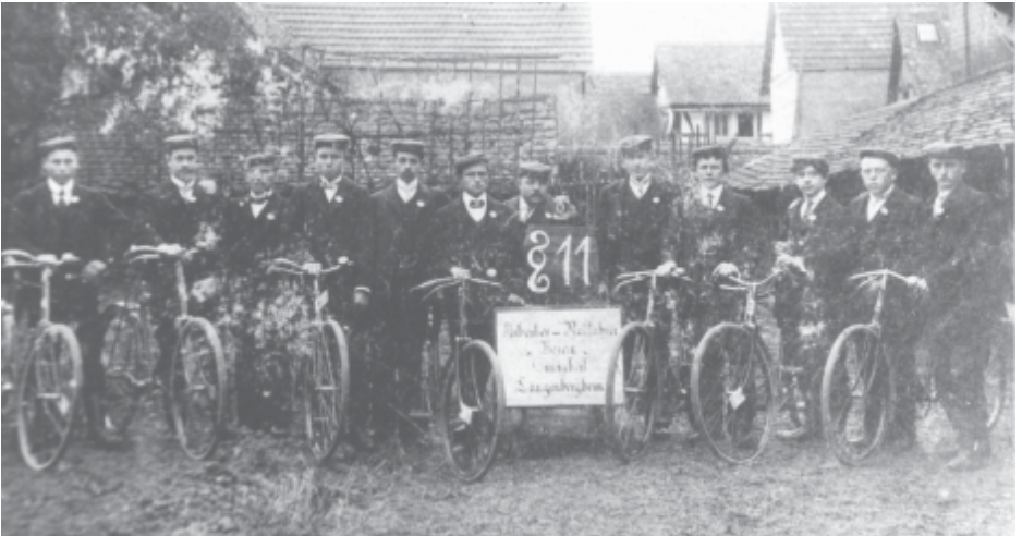
Von Sozialdemokraten 1911 ins Leben gerufen: Der Radfahrer-Verein „Einigkeit“.

Nachhinein ein Bild der Gemeindeentwicklung geben zu können. Die mündliche Überlieferung der älteren Bürger setzt erst in den Zwanziger Jahren ein. Bis dahin hatte sich aber die politische Situation in Deutschland grundlegend verändert. Am Ende des vierjährigen Ersten Weltkrieges brach das Kaiserreich zusammen. Der letzte kaiserliche Reichskanzler übergab dem Sozialdemokraten Friedrich Ebert das Amt und die Verantwortung für ein militärisch und wirtschaftlich geschlagenes Deutschland. Die Sozialdemokraten retteten Deutschland vor einem Bürgerkrieg nach russischem Muster. Zur Aufrechterhaltung der wirtschaftlichen Versorgung und der öffentlichen Ordnung wurden im November 1918 Arbeiter- und Soldatenräte gebildet, die sich erst 1920/21 auflösten. 1919 fanden die Wahlen zur Verfassungs-