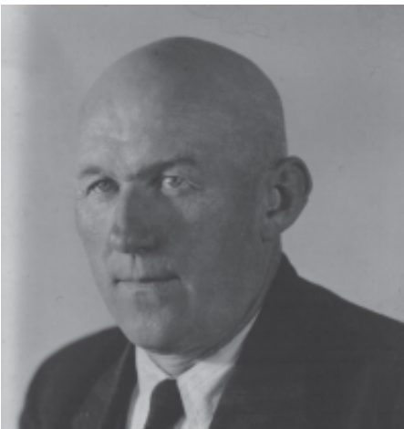
Weißbindermeister Karl Kraft wurde erster Nachkriegs-Bürgermeister.

In seiner dreijährigen Dienstzeit bis 1948 versuchte er, eine richtungweisende und verantwortungsbewußte Politik durchzuführen. Besonders setzte er sich für die Kriegsheimkehrer ein. Für die Schwerbehinderten, die ihren erlernten Beruf nicht mehr ausüben können, beschaffte er sofort eine Beschäftigung