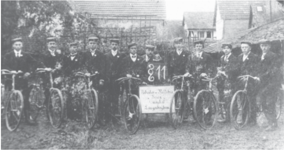
Von Sozialdemokraten 1911 ins Leben gerufen: Der Radfahrer-Verein „Einigkeit“.

Nachhinein ein Bild der Gemeindeentwicklung geben zu können. Die mündliche Überlieferung der älteren Bürger setzt erst in den Zwanziger Jahren ein. Bis dahin hatte sich aber die politische Situation in Deutschland grundlegend verändert. Am Ende des vierjährigen Ersten Weltkrieges brach das Kaiserreich zusammen. Der letzte kaiserliche Reichskanzler übergab dem Sozialdemokraten Friedrich Ebert das Amt und die Verantwortung für ein militärisch und wirtschaftlich geschlagenes Deutschland. Die Sozialdemokraten retteten Deutschland vor einem Bürgerkrieg nach russischem Muster. Zur Aufrechterhaltung der wirtschaftlichen Versorgung und der öffentlichen Ordnung wurden im November 1918 Arbeiter- und Soldatenräte gebildet, die sich erst 1920/21 auflösten. 1919 fanden die Wahlen zur Verfassungs-