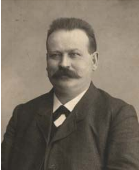
Heinrich Busold von 1910 – 1912 SPD-Reichstagsabgeordneter im Wahlkreis Büdingen – Vilbel – Friedberg.

berger Stadtverordnetenversammlung ein, der er fast ununterbrochen bis zu seinem frühen Tod 1915 angehörte. Seit 1908 war er Parteisekretär in Friedberg und damit für alle organisatorischen und sozialen Fragen der einfachen Leute - und dazu gehörten zunehmend auch die Kleinbauern der Wetterau - zuständig.